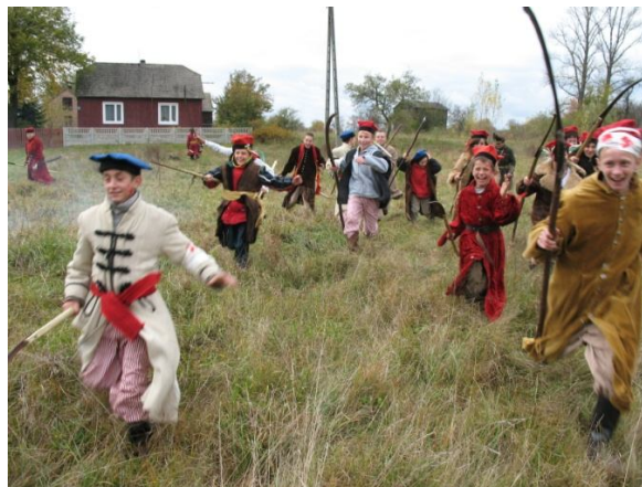
Przeгляд „Kultura Młodych Twórców” oraz inscenizacja bitwy pod Nieznanicami - Kruszyńą