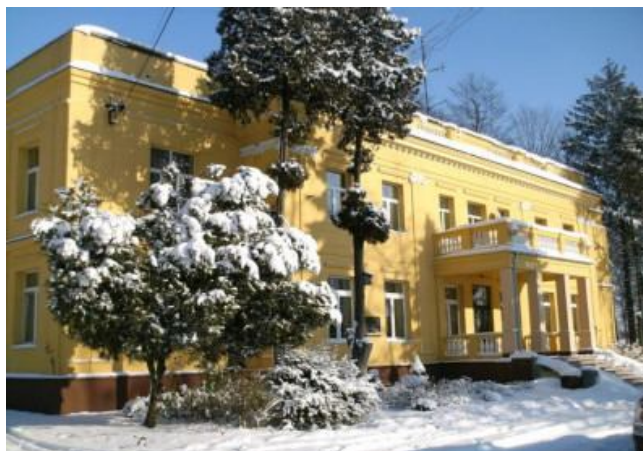
Dom Dziecka w zimowej szacie