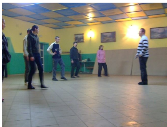
Chorzenice miejscem lokalnej aktywności na płaszczyźnie sportowej, kulturalnej