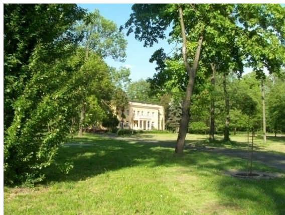
Dworek w okresie przedwojennym i dzisiaj

Przepiękny park o powierzchni około 4 ha położony jest w centrum miejscowości. Na jego terenie znajduje się pałac pochodzący z pocz. XX w - dawna posiadłość rodziny Nieniewskich w której obecnie mieści się tutaj Państwowy Dom dziecka. Od strony zachodniej park przylega do ulicy Głównej natomiast stronę południową ogranicza ulica Parkowa, która przecina dawną posiadłość na dwie części. W północno zachodniej części parku znajduje się plac zabaw dla dzieci, natomiast w jego środkowej części wytyczono boisko sportowe.