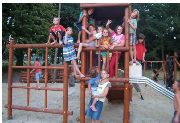
Praca przy placu zabaw przykładem integracji i współpracy