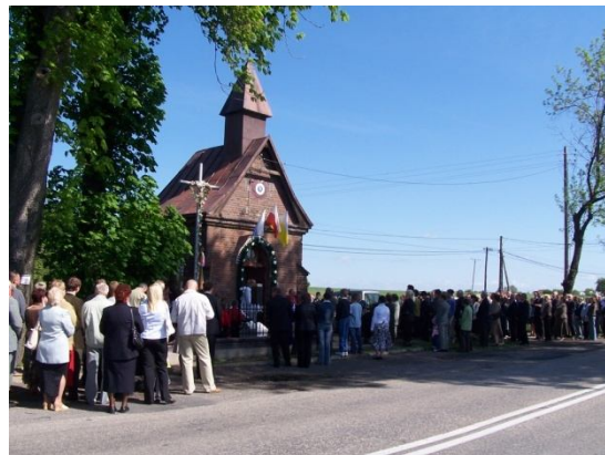
Kapliczka integruje na co dzień i od święta