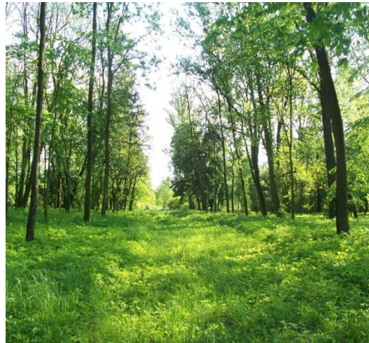
Park w Chorzenicach : alejka dojazdowa przed wojną i obecnie

Park w Chorzenicach cechuje bardzo duża różnorodność gatunków drzew i krzewów. Wiele z nich pamięta jeszcze czasy ostatnich właścicieli i czasy świetności parku. Wśród drzew znajdziemy lipy drobnolistne, najokazalsza z nich znajduje się we wschodniej części parku. Od strony zachodniej, wzdłuż granicy parku rosną kasztanowce białe, które najpiękniej wyglądają w maju kiedy przepięknie kwitną. Na planie parku zarysowuje się wyraźnie kilka alejek. Do budynku prowadziła aleja akacjowa wysadzona robiniami akacjowymi, które również zachowały się do czasów dzisiejszych. Od strony wschodniej rosną jesiony wyniosłe oraz klony zwyczajne na przemian z klonami jaworami. Z innych drzew, które spotykamy w parku należy wymienić: brzozę brodawkowatą, olszę czarną, wiąz, topolę białą oraz okazałe dęby szypułkowe. Również bardzo bogatą różnorodnością gatunków cechują się krzewy. Spotykamy